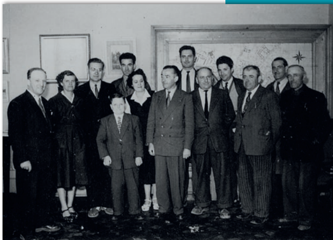
© Pôle Mémoire de Montauban, Archives municipales (2F11). Portrait des agents des services techniques.