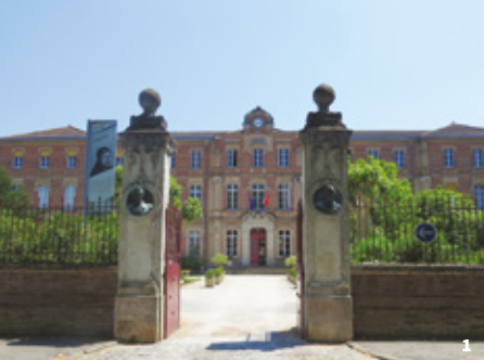
1. Portail et façade du collège Ingres