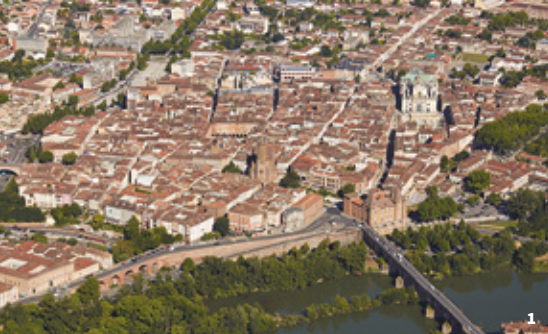
1. Vue aérienne