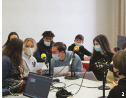
2. et 3. Les élèves de la classe 308