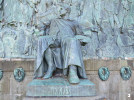
1. Etex, Monument à Ingres