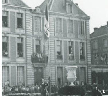
1. La libération de Montauban