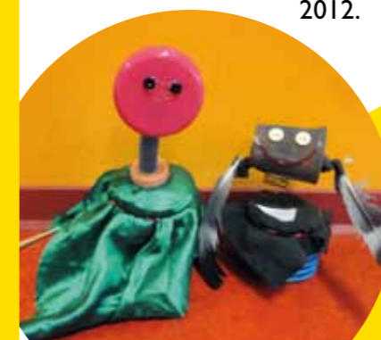
Atelier Recup' Art

Fin novembre, à l'occasion de la semaine européenne de la réduction des déchets, les enfants ont également participé à de nombreuses animations : goûter zéro déchet à Saint Nicolas de la Grave, visite de la Recyclerie à Castelsarrasin et atelier recup'art, pour créer des objets à partir de déchets, à Montauban.