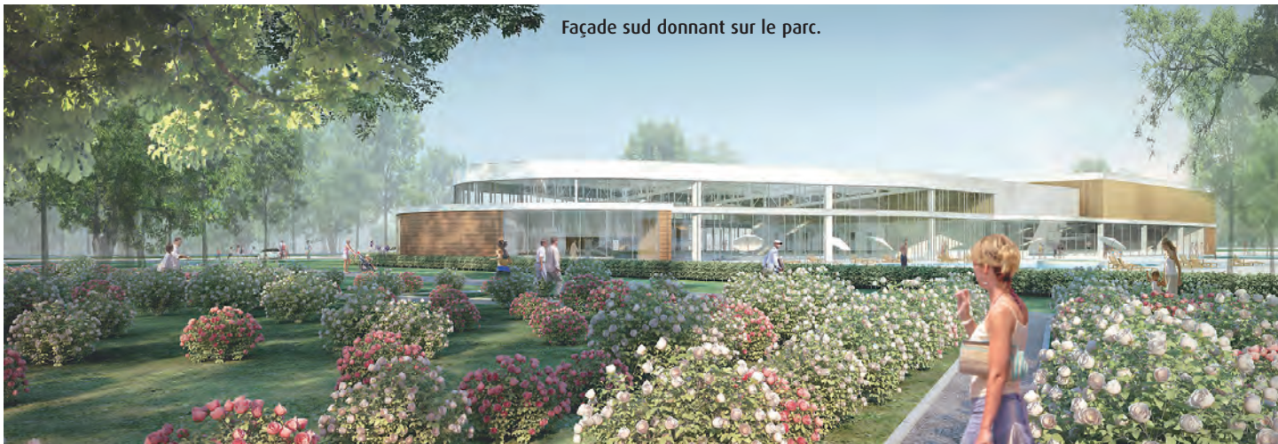
Façade sud donnant sur le parc.

Le complexe aquatique de Chambord est un projet depuis longtemps envisagé par la ville compte tenu de l'état de la piscine actuelle. En 2009, le conseil municipal a adopté le principe d'un contrat de partenariat public-privé afin de se donner les moyens de réaliser un projet ambitieux. Les candidatures des opérateurs ont été reçues par la ville et les auditions des trois finalistes ont été faites. Le 31 janvier dernier, le conseil municipal a choisi le constructeur du complexe aquatique. Le projet gagnant, original, respectueux de l'environnement et novateur a été présenté par le Groupe Vinci.